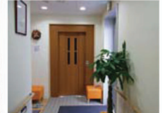
▲2Fに上がるエレベーター