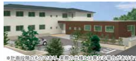
※計画段階のものであり、実際の仕様とは異なる場合があります。

駅から徒歩7分なのでお仕事帰りでも 様子を見に来られます! 「施設敷地内」にご家族様駐車場も 完備しております。お気軽にお越し下さい。