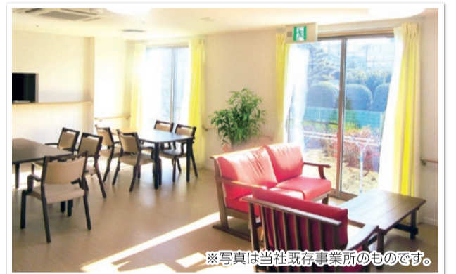
※写真は当社既存事業所のものです。