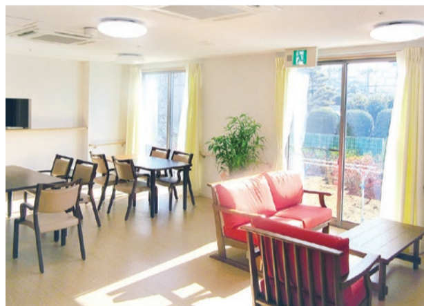
※写真は当社既存事業所のものです